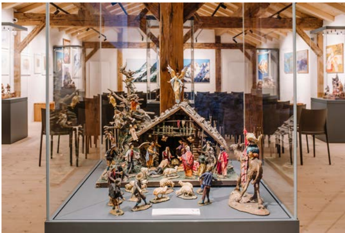
eine Krippe des Pinzgauer Krippenvaters Xandi Schlöffler